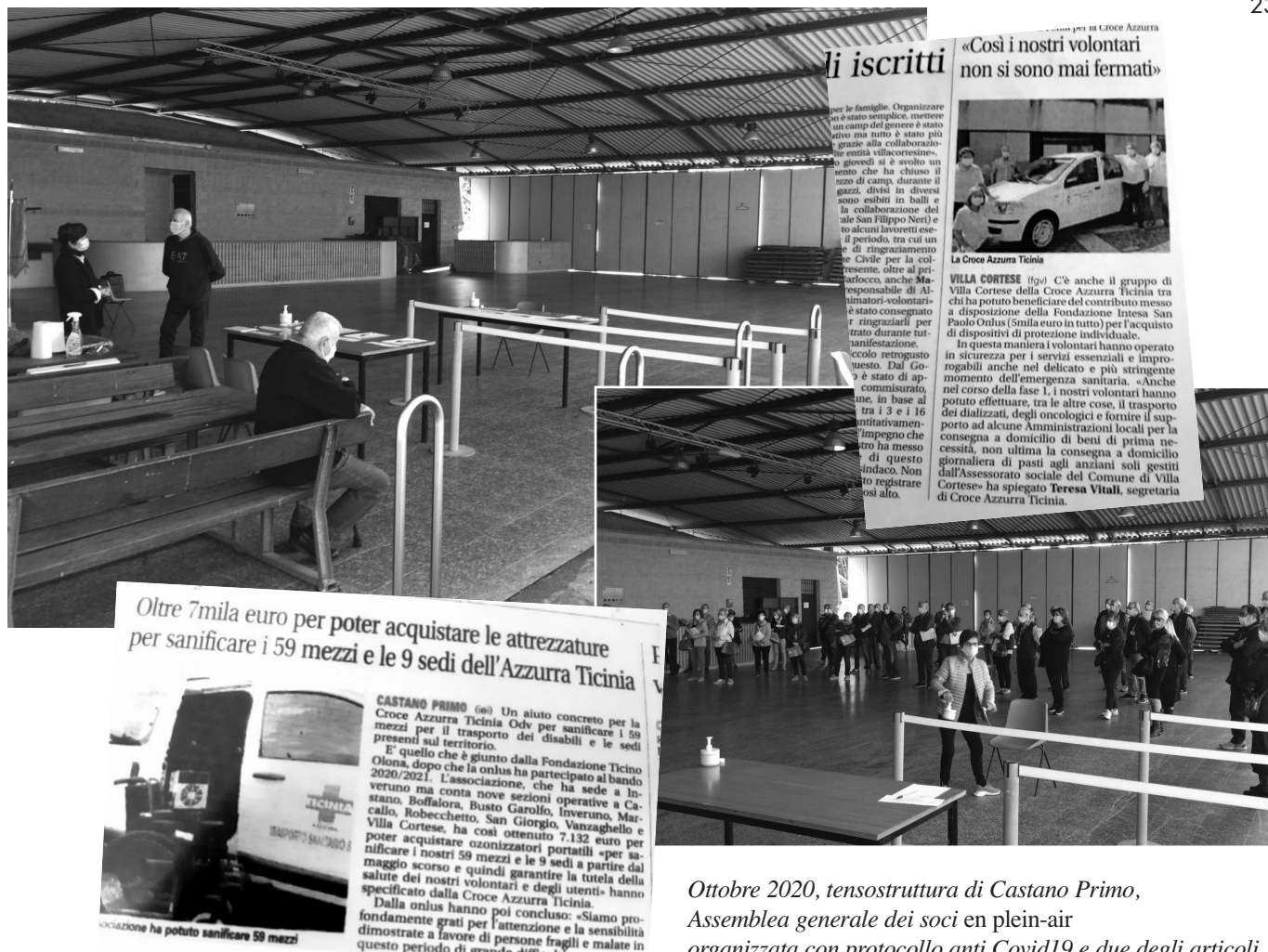
Ottobre 2020, tensostruttura di Castano Primo, Assemblea generale dei soci en plein-air organizzata con protocollo anti Covid19 e due degli articoli usciti sul periodico Settegiorni su questo tema.