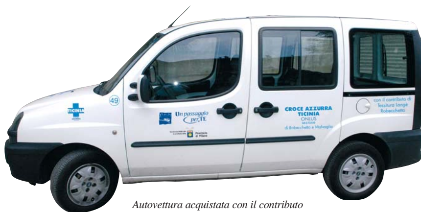
Autovettura acquistata con il contributo provinciale sul bando "Un passaggio per te".

Per il prossimo anno 2009 è prevista la sostituzione dell'autovettura donata da TRC Candiani.