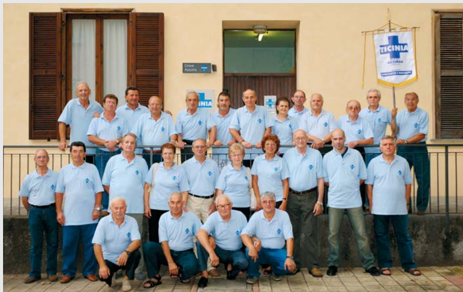
Gruppo di volontari davanti all'ingresso della sede.