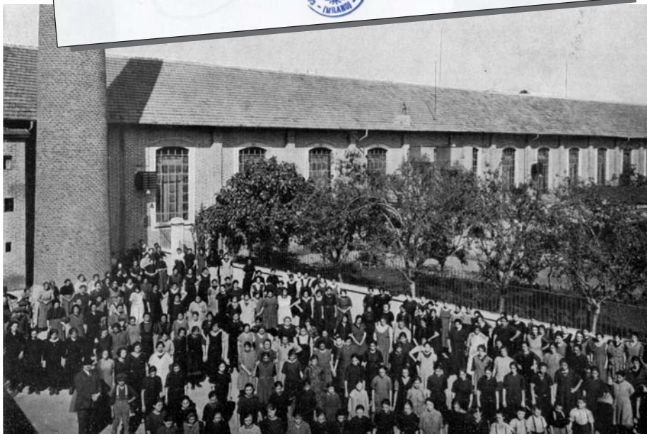
I lavoratori della Filanda Rusconi a Robecchetto nel 1924.