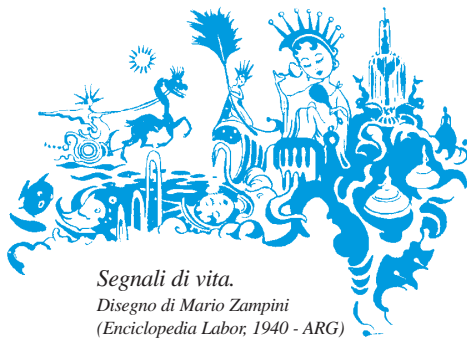
Segnali di vita.

(Iscrizione trovata sul muro della Casa dei Bambini di Calcutta.)