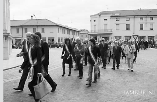
Qui sopra, due momenti dei festeggiamenti per il decennale.