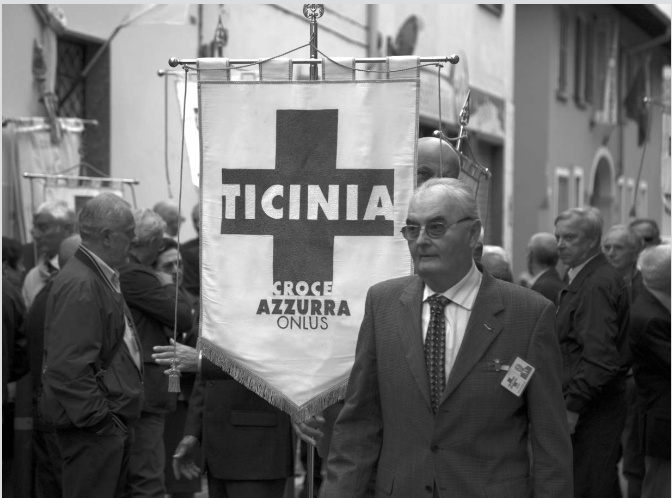
Il trentennale della Sezione di Vanzaghella.