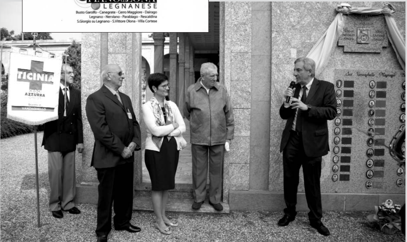
Qui sotto, la lapide commemorativa dei volontari defunti della Sezione di Vanzaghello.